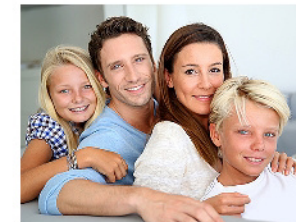
Rauchfrei in der Wohnung