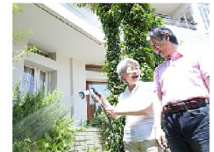
Rauchfrei auf dem Balkon