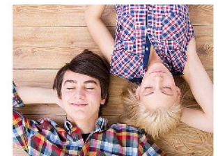
Nur ein Traum, oder?